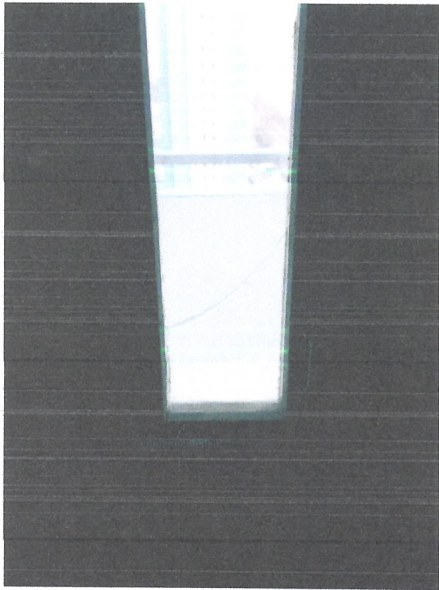
Трещина на стекле