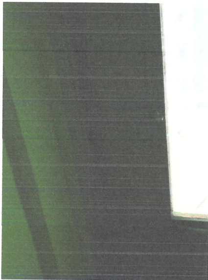
В качестве запирающего устройства служит саморез.