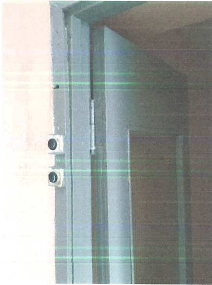
Отсутствует пружина и крепление к ней