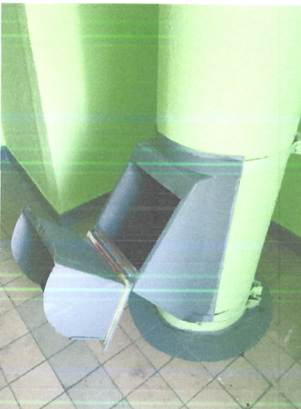
Сломан мусороприёмный ковш