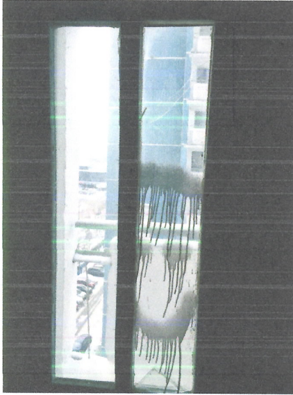
Разбитое и разрисованное стекло