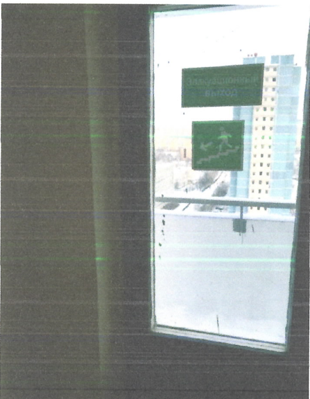
Отсутствуют ручки эвакуационного выхода