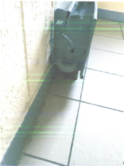
Отсутствует крепление батареи (батарея лежит на банке из-под кофе).